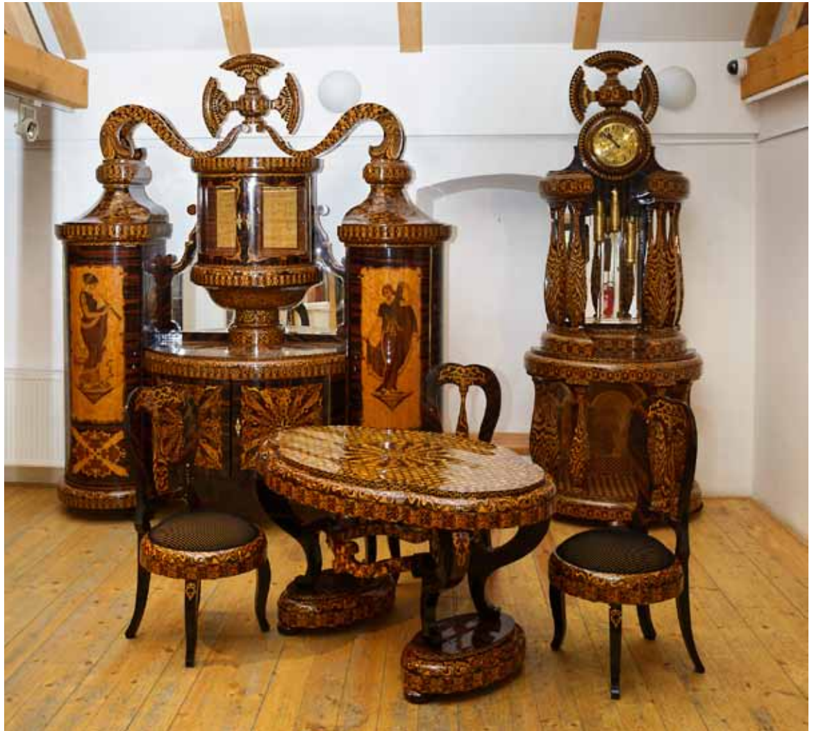
STAV PO RESTAUROVÁNÍ

že vybavení jídelny bylo již v době svého vzniku považováno za unikátní a vzácné,“ domnívá se Fiala.